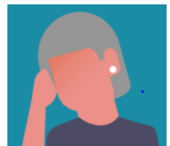
Dolor de cabeza