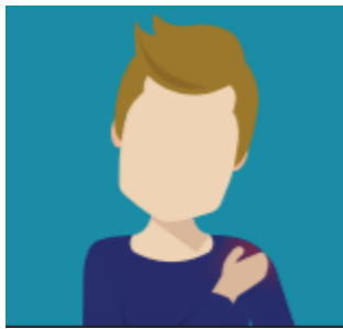
Dolor y hinchazón del brazo