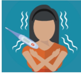
Fiebre o escalofríos